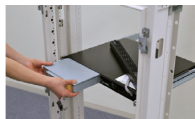
◀ラック設置—バッテリー交換